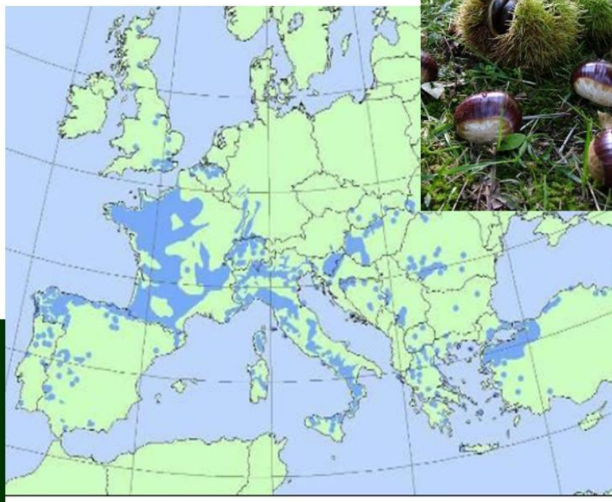
Répartition géographique des C. Sativa .

Toutes les forêts des châtaignier italien souligné sur la carte, sont désormais touchés par l'invasion de la guêpe chinoise.