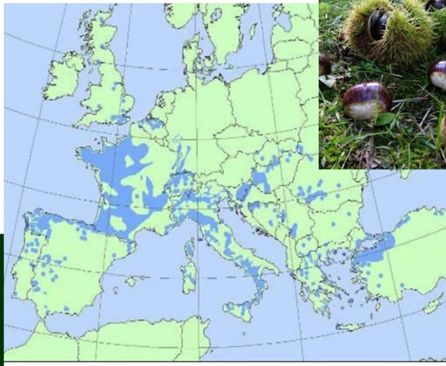
Distribución geográfica de C. Sativa.

Todos los castañedos italianos, mostrados en el mapa, ya están afectados por la invasión de la avispa de las agallas.